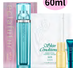
エクラフチュールt60キット 本体60ml 15400円(税込)