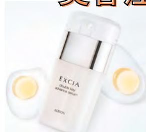
ダブルキーアドバンスセラム 16500円(税込)

エクシア・アンベアージュを 27500円(税込)ご購入で 『ウィンターキャンペーンキット』 プレゼント