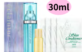
エクラフチュールt30キット 30ml 8250円(税込)