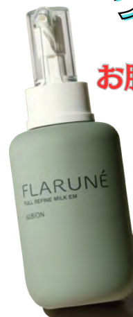
フラルネ フルリファインミルク M/EM 200ml 5500円(税込)