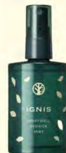
ナイトウェルベストサイドミスト 3850円