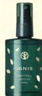
ナイトウェルベストサイドミスト 3850円